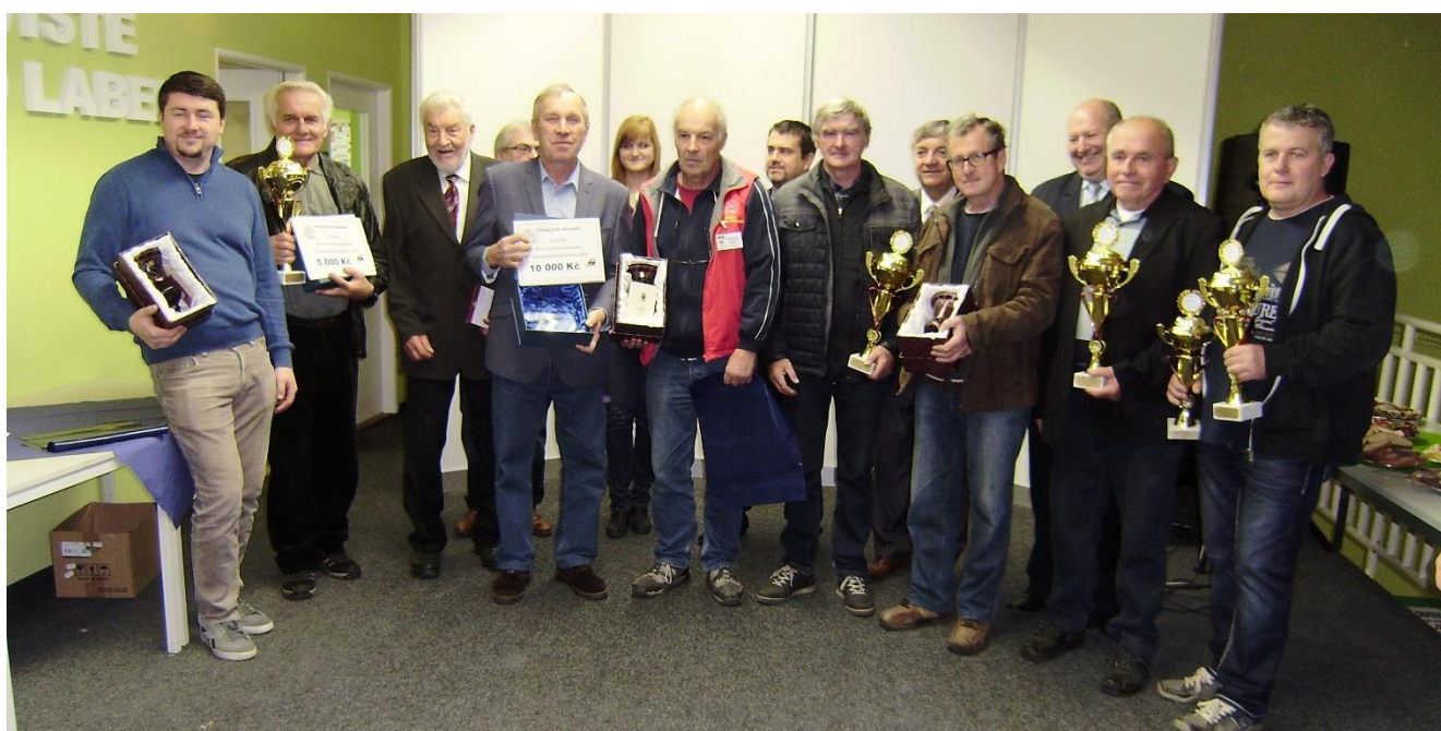
Slavnostní vyhlášení meziokresní soutěže