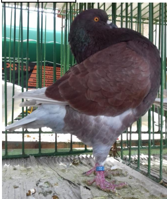
king př. Václava Koláčného oceněný 96 b. a ČC