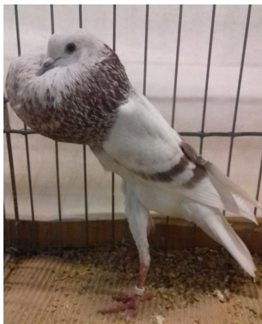
brněnský voláč–KarstenMoller - DK 96 b. ocenění: SE3