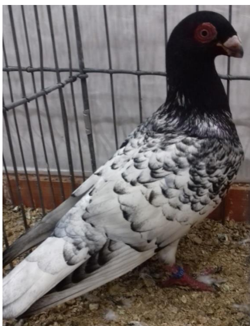
česká bagdeta černá šupinatá - Zdeněk Uhlíř CZ 96 b. ocenění: E2