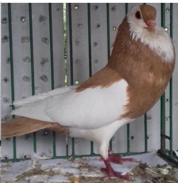
český stavák př. Jiřího Cika- oceněný 96 b. a ČC