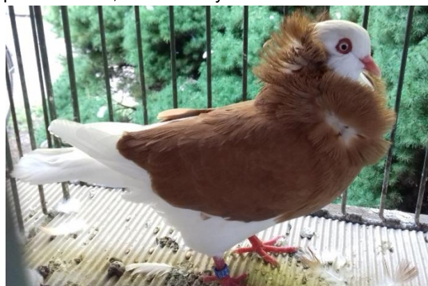
staroholandský kapucín př. Schejbal oceněný 96 b a ČC

Výstava v Holicích je každoročně postavená na chovatelích z domácí organizace. Podle vystavených holubů jsou zaměřeni na tři plemena: české bagdety (letos vystaveno 40 ks), kingy (vystaveno 20 ks) a české staváky (vystaveno 27 ks). Dobré zjištění je, že jednotlivá plemena vystavuje více chovatelů. Obdivovatelé těchto plemen si tak přijdou určit na své. Ostatní vystavená plemena, např. český voláč sivý, staroholandský kapucín, ostravská bagdeta, nebyla početně silná, ale velice vyrovnaná v kvalitě.