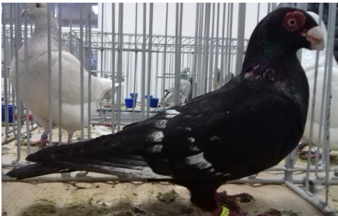
česká bagdeta černá 96 b. - z vítězné kolekce na Okresní výstavě v Holicích - chovatel Zeman Luboš

Počátky Klubu chovatelů holubů bradavičnatých plemen sahají až k datu 1.12.1955. V této době se jednalo pouze o klub chovatelů českých bagdet. Pokusy o založení klubu chovatelů českých bagdet sice probíhaly již od prvního uznání plemene česká bagdeta po roce 1926. Klub se sice podařilo dokonce 2x založit, ale následně byl pro neshody členů také dvakrát zrušen. Až od roku 1955 začal tedy fungovat Klub chovatelů české bagdety, přímý předchůdce Klubu chovatelů holubů bradavičnatých plemen. V roce 1981 přistoupili do klubu chovatelé dragounů a indiánů, které později následovali i chovatelé kariérů. Od 7.1.2006 byl proto klub přejmenován na Klub chovatelů bradavičnatých plemen. Pracovní náplní klubu je sdružovat chovatele bradavičnatých plemen holubů a pořádat klubové výstavy. V roce 1981 se konala první společná výstava bradavičnatých plemen v Kunovicích u Uherského Hradiště. Další výstavy (mimo roku 1987) se konaly již jen v Holicích. V roce 1987 se výstava konala v Újezdě u Brna. Výstav se účastní i chovatelé jiných bradavičnatých plemen, kteří mají své samostatné kluby (např. chovatelé moravských a ostravských bagdet). Od roku 2001 má klub sídlo v Holicích (do té doby bylo sídlo klubu v Chrudimi). Dlouholetým předsedou je př. Uhlíř Zdeněk , jednatelem klubu př. Kropáček Jaromír (kontakt – mobil: 728 254 964, email: kropacek.jaromir@seznam.cz).