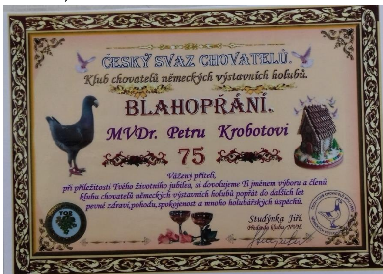
blahopřání, pro člena klubu