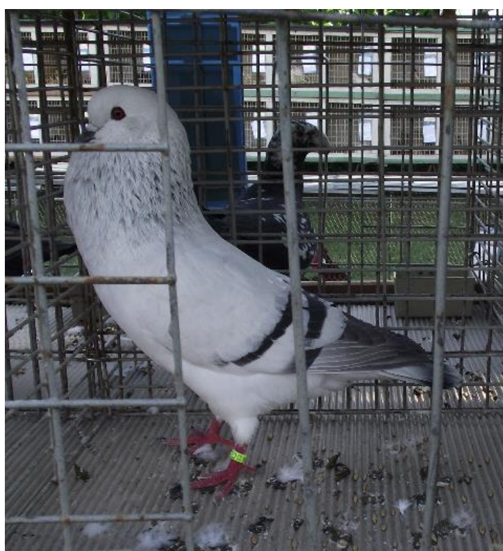
vítěz výstavy - český stavák sivý (96 b.) - chovatel př. Cik Jiří