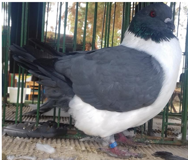
Moravský pštros modrý př. Komárka – vítěz výstavy

Soutěžní kolekce chovatelů okr. Pardubice