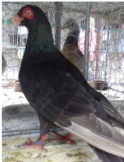
Kopecký Pavel - česká bagdeta 95 b - čc.

Expozice holubů ve Svítkově byla skutečně pouze ukázková. Celkový počet 48 kusů návštěvníky nijak neohromí. Potěšitelné je alespoň předvedení 26 holubů národních plemen. K vidění byli také maďarští obři, kteří nejsou příliš rozšířeným plemenem.