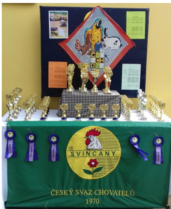
vítězné ceny připravené ke slavnostnímu vyhlášení