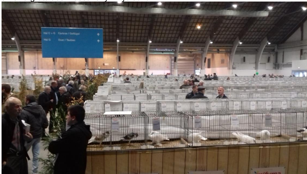
pohled do výstavní haly holubů

Účast a výsledky holubařů okr. Pardubice byly vynikající. Přesné počty a výsledky jsou přehledně uvedeny v tabulce níže. Jen pro shrnutí: našich 8 chovatelů předvedlo 44 holubů a podařilo se jim domů přivést titul Mistra Evropy (př. Uhlíř) a dalších 5 ocenění (př. Dočkal 2x, př. Blažek, př. Kropáček a př. Mach). Všem vystavovatelům okr. Pardubice patří poděkování a velká gratulace k dosaženým výsledkům.