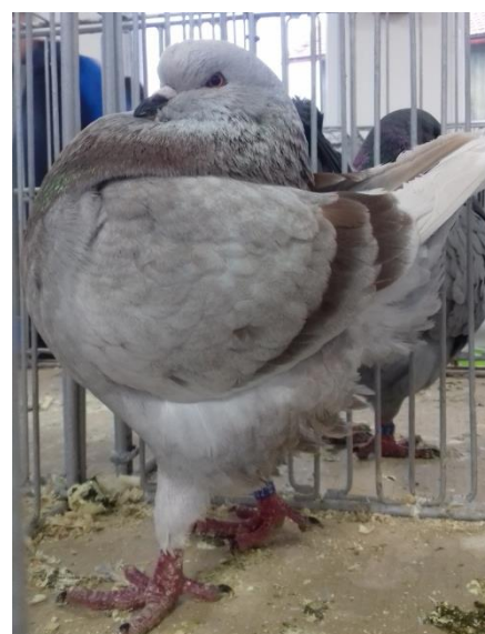
moravský pštros 96 b-čc - Čep V./ kariér červený- 94 b. - Kropáček J./ king plavý 97 b. Grand šampion-Poděbradský J.