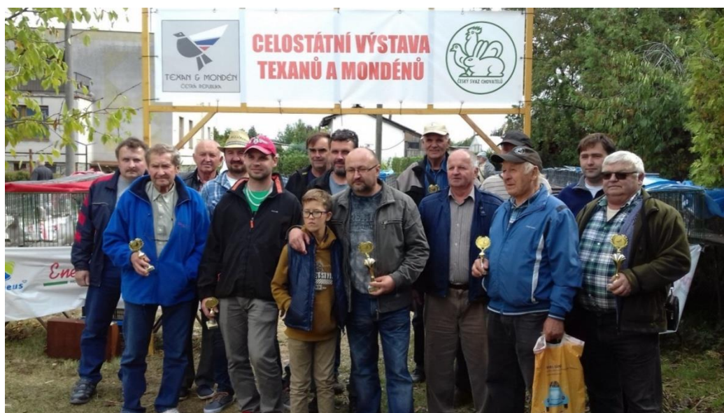
Společné foto chovatelů texanů a monděně