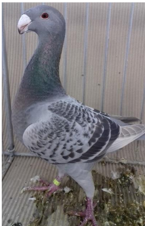
NVH stříbřitý kapratý - 96 b. Hedvíček Jindřich