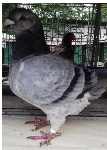
Mastík Zdeněk - gigant 95 b. čc