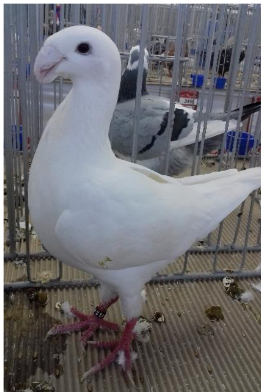
NVH bílý 96 b. - šampion - Oravec Ivan