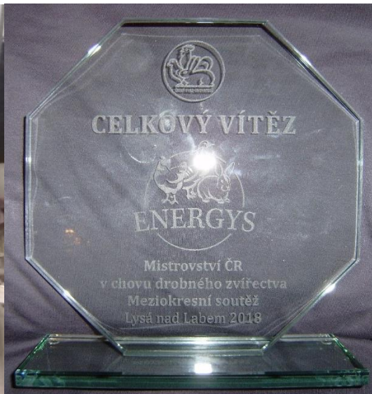
moravský pštros černý šupinatý př. Jiřího Říhy, trofej za 1. místo v meziokresní soutěži