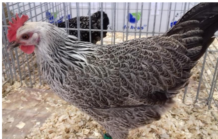
česká slepice stříbrná kropenatá oc. 98 b.