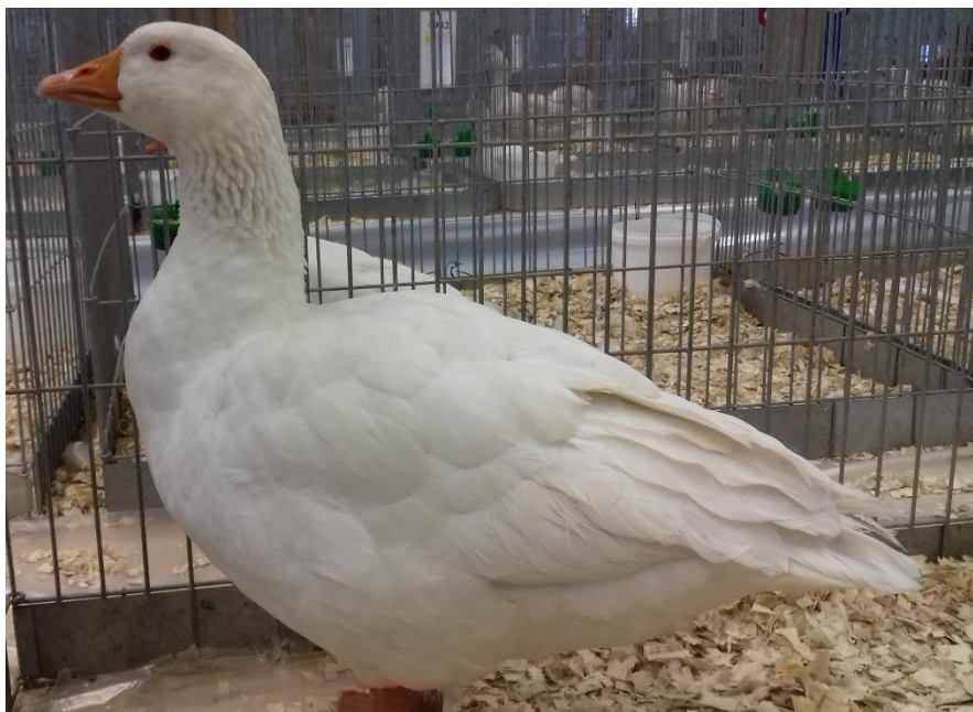
husa česká bílá oceněná 95 b. a pohárem pro nej. 1.0 hČ – chovatel Miloš Rejfek

Účast chovatelů okresu Pardubice byla solidní a především se naši chovatelé prezentovali kvalitními zvířaty, což dokonce vyústilo ve vítězství v meziokresní soutěži u drůbeže, pro mnohé překvapivě. Neúspěšnějším chovatelem okr. Pardubice se stal př. Matěj Pfeifer, který se stal šampionem ČR, vítězem plemene, získal 2 poháry (vše za k Č dblem) a čestnou cenu (AU č). Pohár získal také př. Rejfek (h Č) a vítězem plemene se stali př. Blažek (L) a př. Rejfek (k N čb). Poděkování za vzornou reprezentaci patří všem vystavovatelům okr. Pardubice.