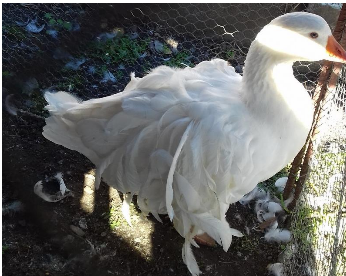
husa Kadeřavá př. Josefa Štrose – 96 b. vítěz 0.1