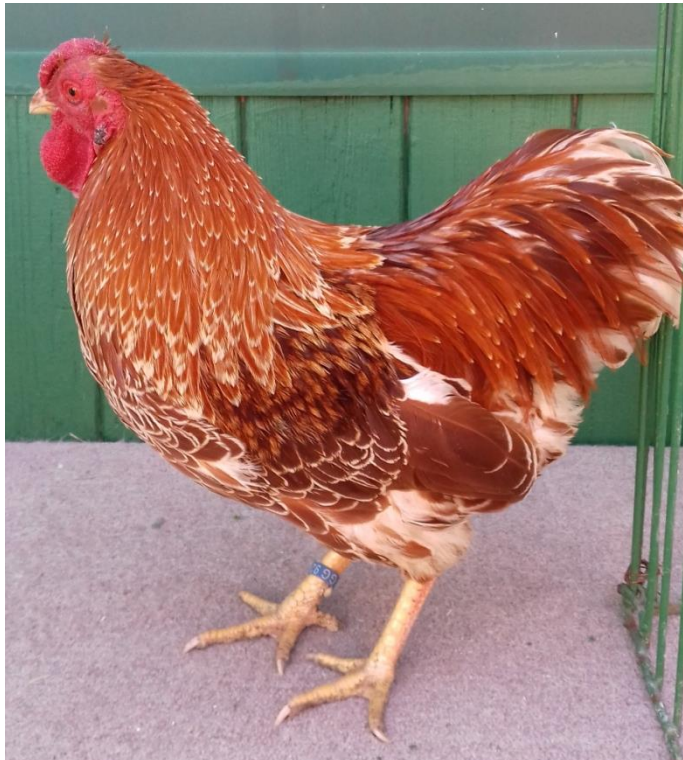
zdrobnělá brahmánka koroptví vlnitá př. Květy Brožové – oc. 96 b. (vítězná 0.1) a kohout zdrobnělé vyandotky zlaté bílé lemované př. Miroslavy Hrubešové oceněný 95,5 b. (čc)