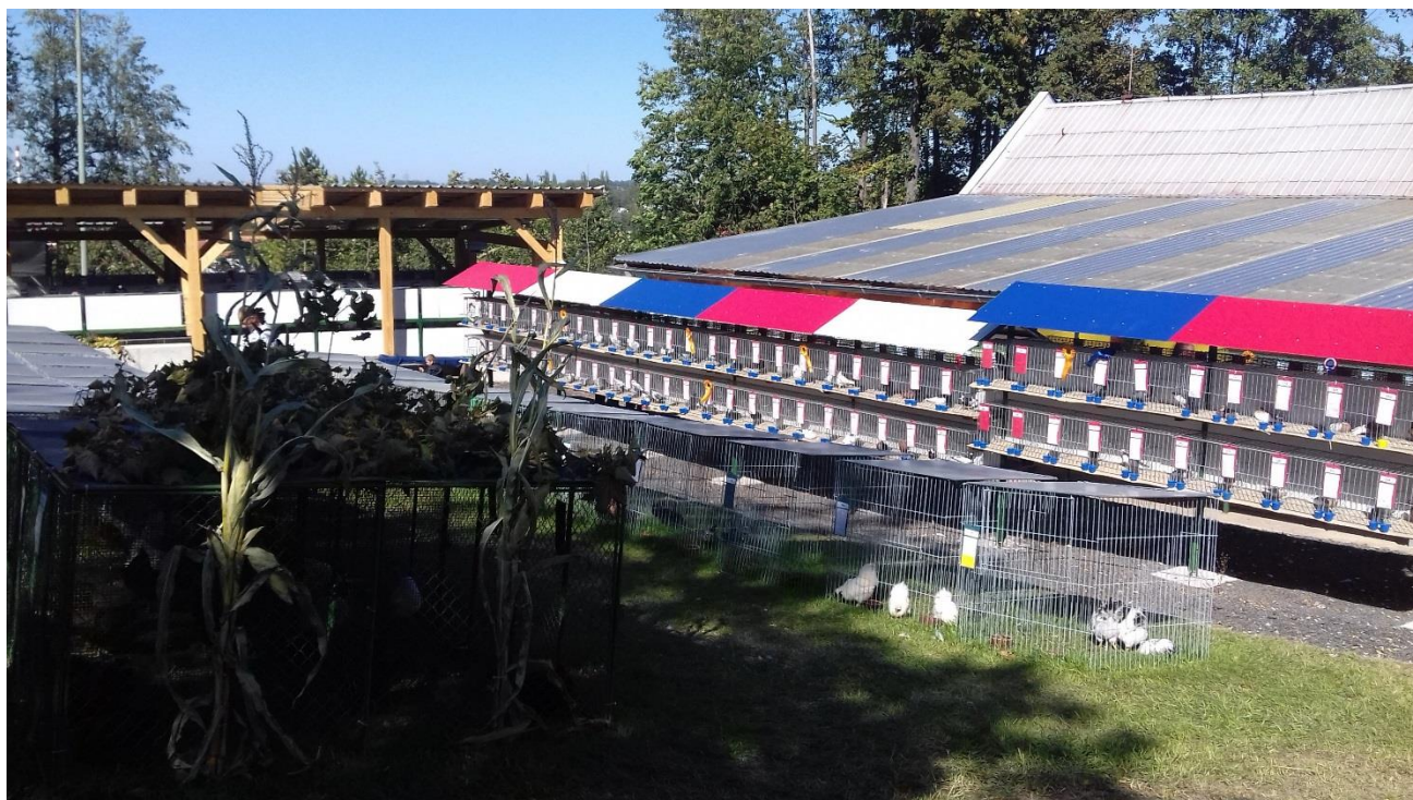
pohled na areál výstaviště v Litomyšli