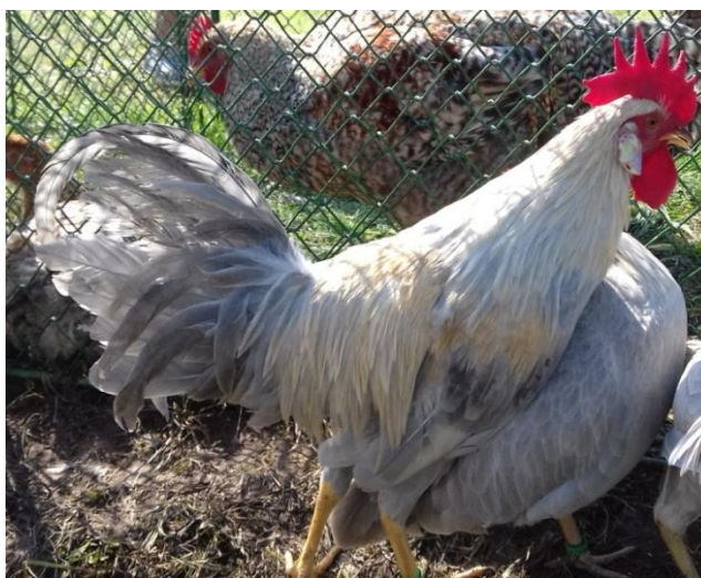
vlašky zdobnělé šedé oranžovo zbarvené př. Anety Knížkové