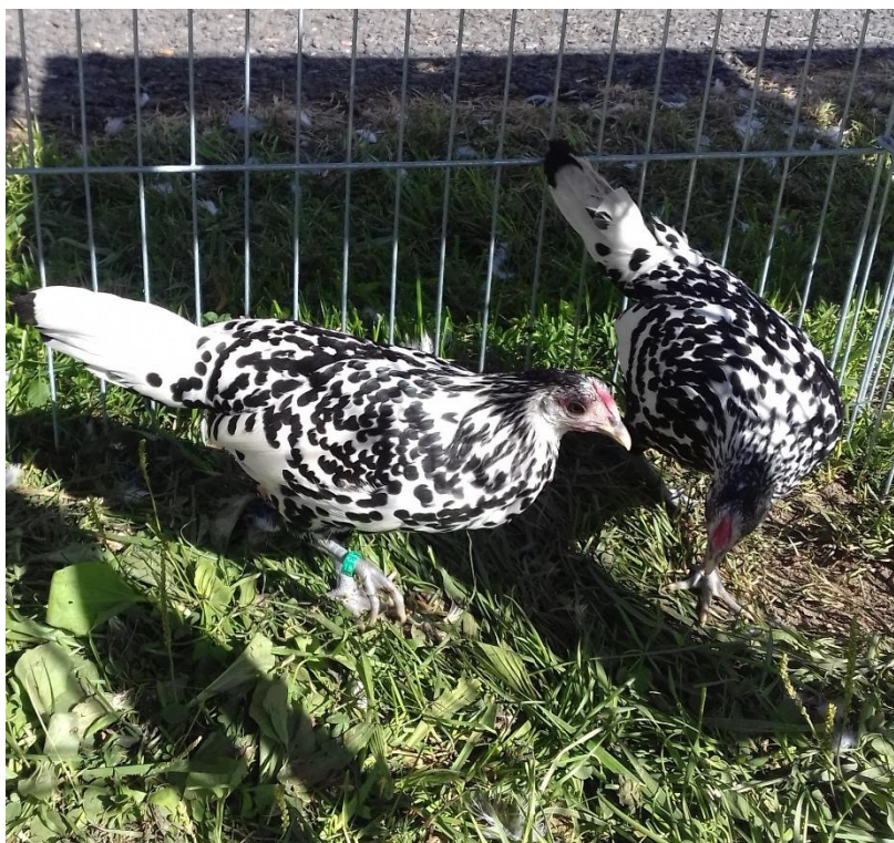
z HA stčt chovatele Tomáše Macha oceněné 282 b. a čestnou cenou