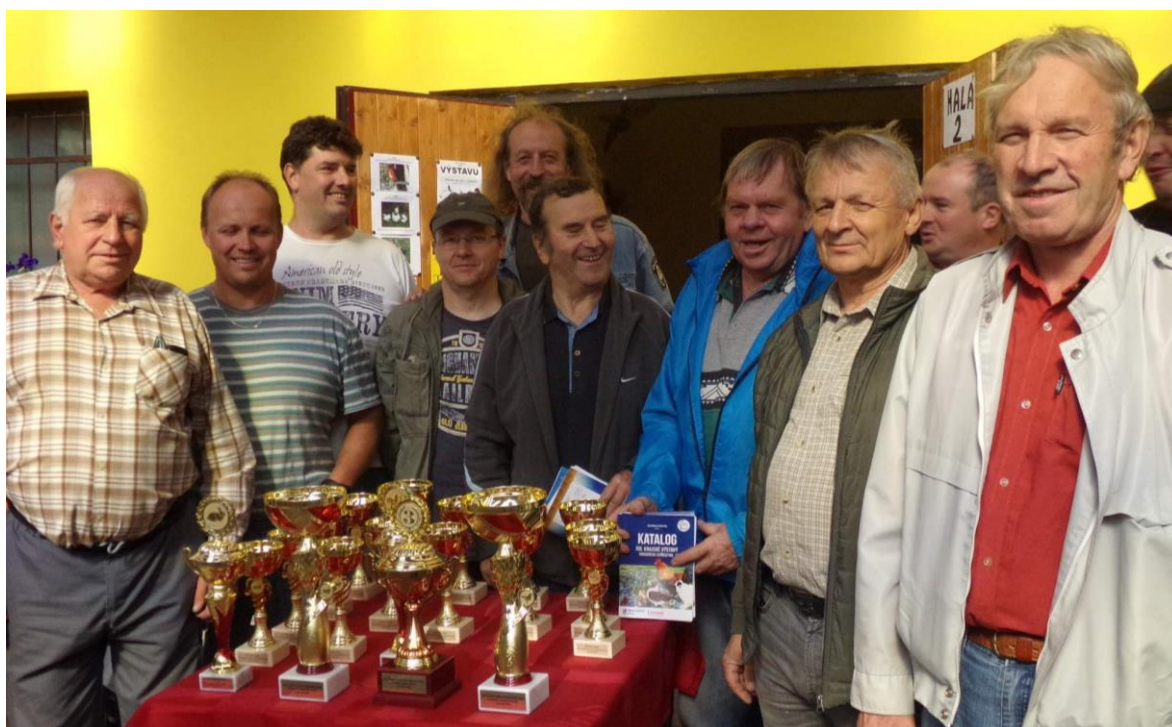
zástupci okr. Pardubice po slavnostním vyhlášení