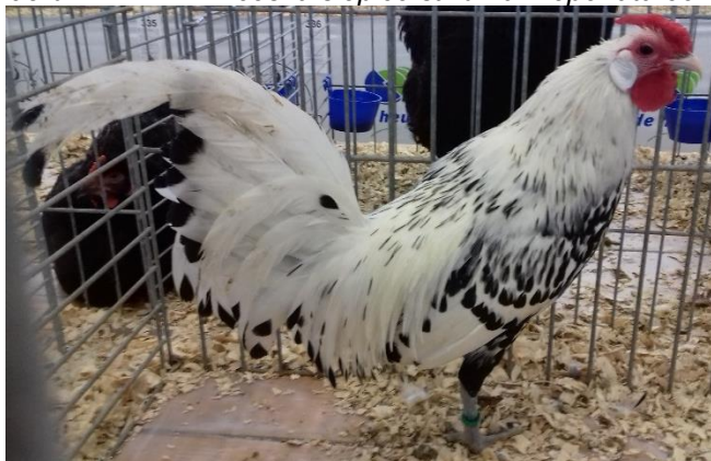
hamburčanka zdrobnělá stříbrná černě tečkovaná oc. 95 b. – chovatel Tomáš Mach