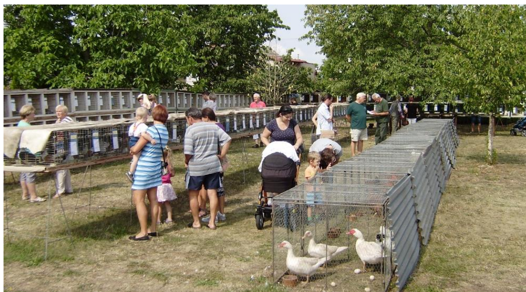
pohled na výstaviště