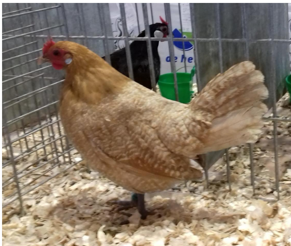
fríská slepice zdrobnělá žlutá bíle vločkovaná oc. 93,5 b. (Moravia Brno 2019)