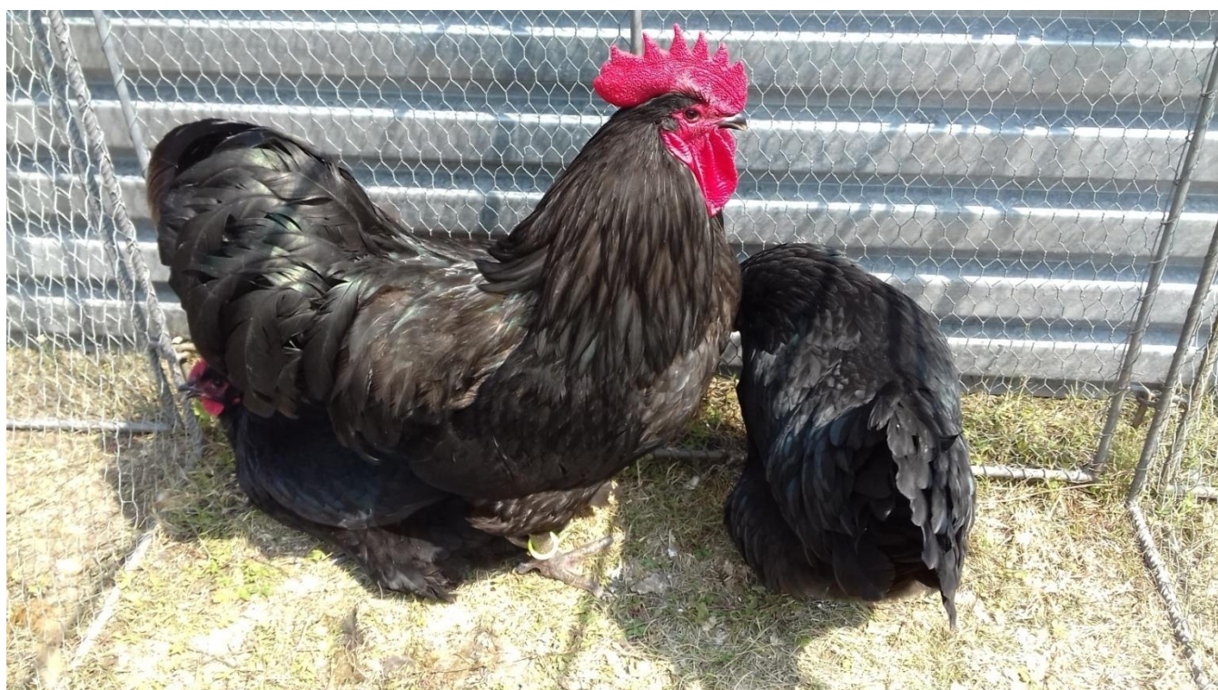
vítězná kolekce australek černých př. Matěje Pfeifera