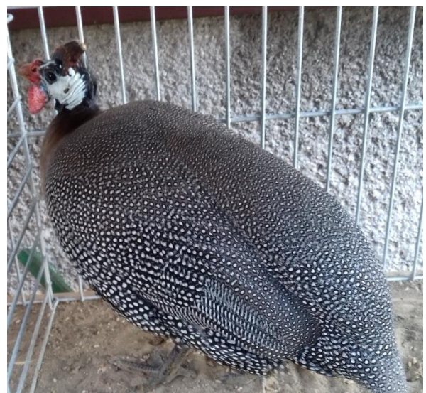
perlička př. Matěje Pfeifera oceněná 95 b. a čc