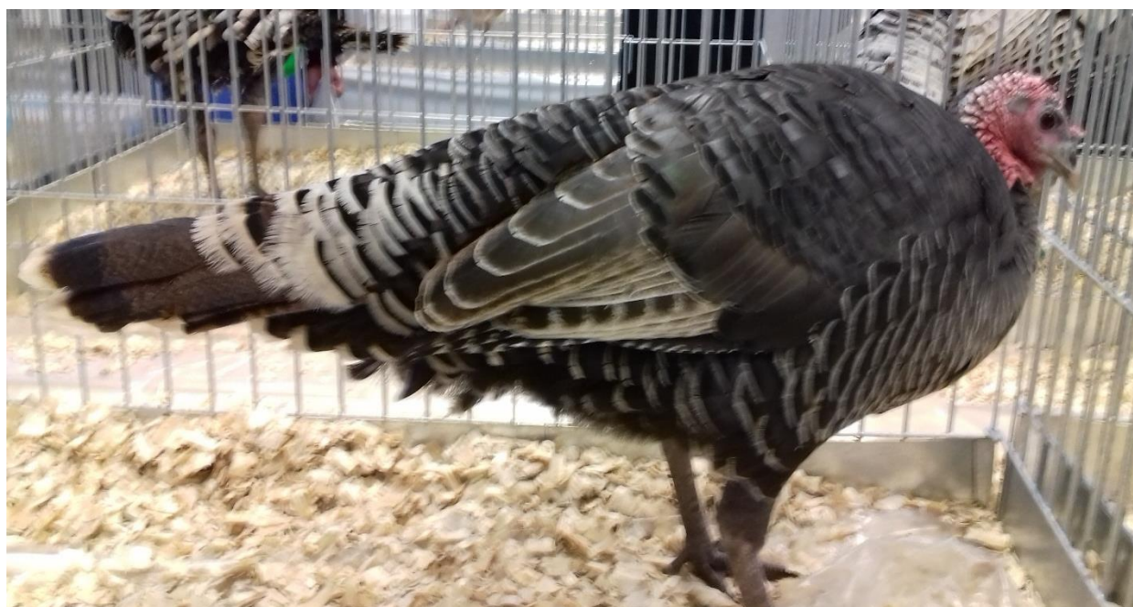
Krůta česká divoká bíle lemovaná – oceněná 98 b. vítěz plemene + poháry pro nej. krůtu a nej. krůtu 0.1 – chovatel Matěj Pfeifer