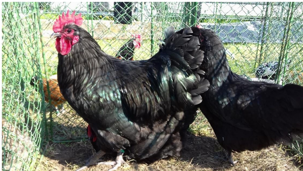
vítězná kolekce okresní výstavy – australky černý př. Matěje Pfeifera