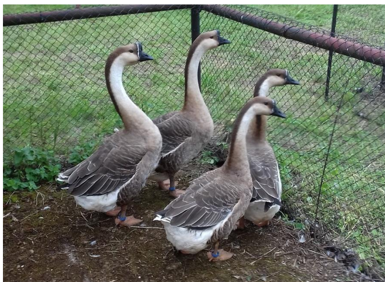
husy labutí v ukázkové expozici