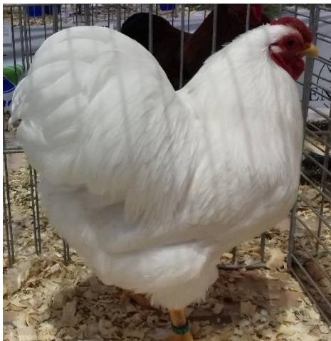
vyandotka zdrobnělá bílá oc. 98 b.