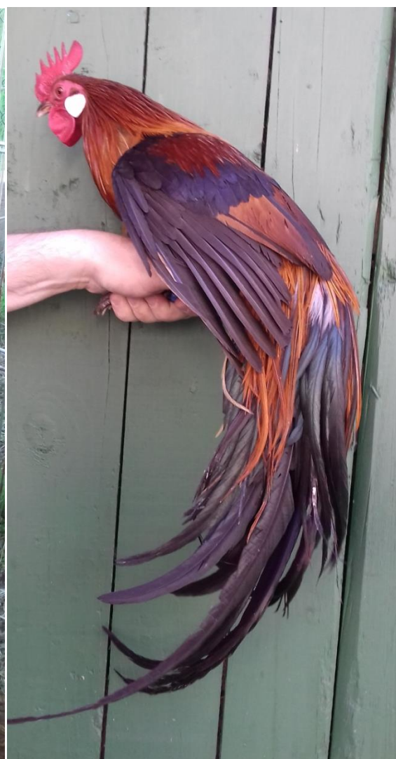
vítězná kolekce českých slepic zlatých kropenatých př. Jana Nováka a vítězný kohout fénixky zdobnělé zlatokrké př. Daniely Dalecké oceněný 98,5 b.