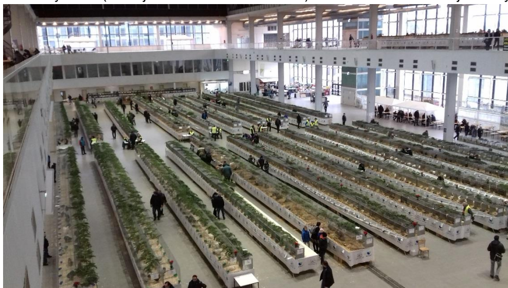
pohled na výstavní halu

Výstava se konala v pěkných prostorných halách, se zajímavou výzdobou. Z čeho jsem byl ovšem zklamán, bylo osvětlení. U holubů a zakrslých králíků na galerii s osvětlením problém nebyl, ovšem v přízemí bylo osvětlení nedostatečné a navíc výzdoba (větve Jehličí umístěné na klecích) nedostatečné osvětlení ještě zvýraznila.