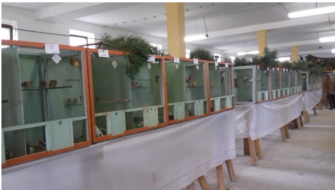
pohled na okresní výstavu exotického ptactva

Výstava je tradičně velkou společenskou událostí, kterou dotváří především doprovodný program. Jako je živá hudba, ukázky řemeslných výrobků a další volnočasové aktivity. Vedle okresní výstavy exotického ptactva byly k vidění i další zvířata jako jsou nutrie nebo koně.