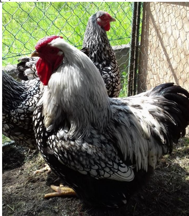
vyandotky stříbrné velké př. Pavla Hrubeše