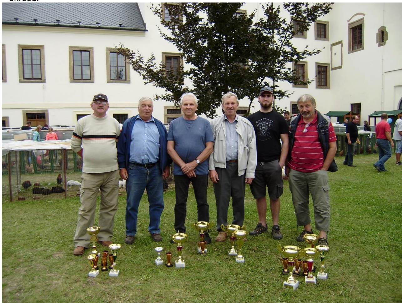
Zástupci okresu Pardubice po slavnostním vyhlášení výsledků

Z pohledu okr. Pardubice byla XI. Krajská výstava přímo triumfální. Naši chovatelé zvítězili ve všech odbornostech, což se za dobu konání KV ještě nestalo. Celkový bodový rozdíl činil skoro 90 bodů na druhého v pořadí. Po sportovní stránce jsme tak dosáhli úspěchu, který se bude nejen těžce překonávat, ale i těžko opakovat. Na závěr patří poděkování všem zúčastněným z našeho okresu.