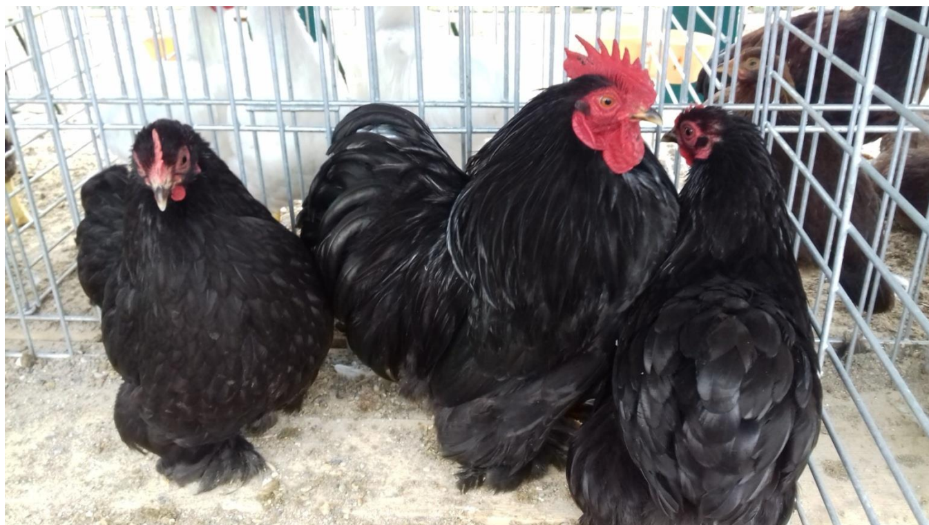
kočinky zakrslé černé ing. Petra Blažka, které obsadily v okresní soutěži 5. místo