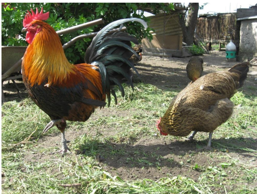
Pohled do „členitého“ výběhu