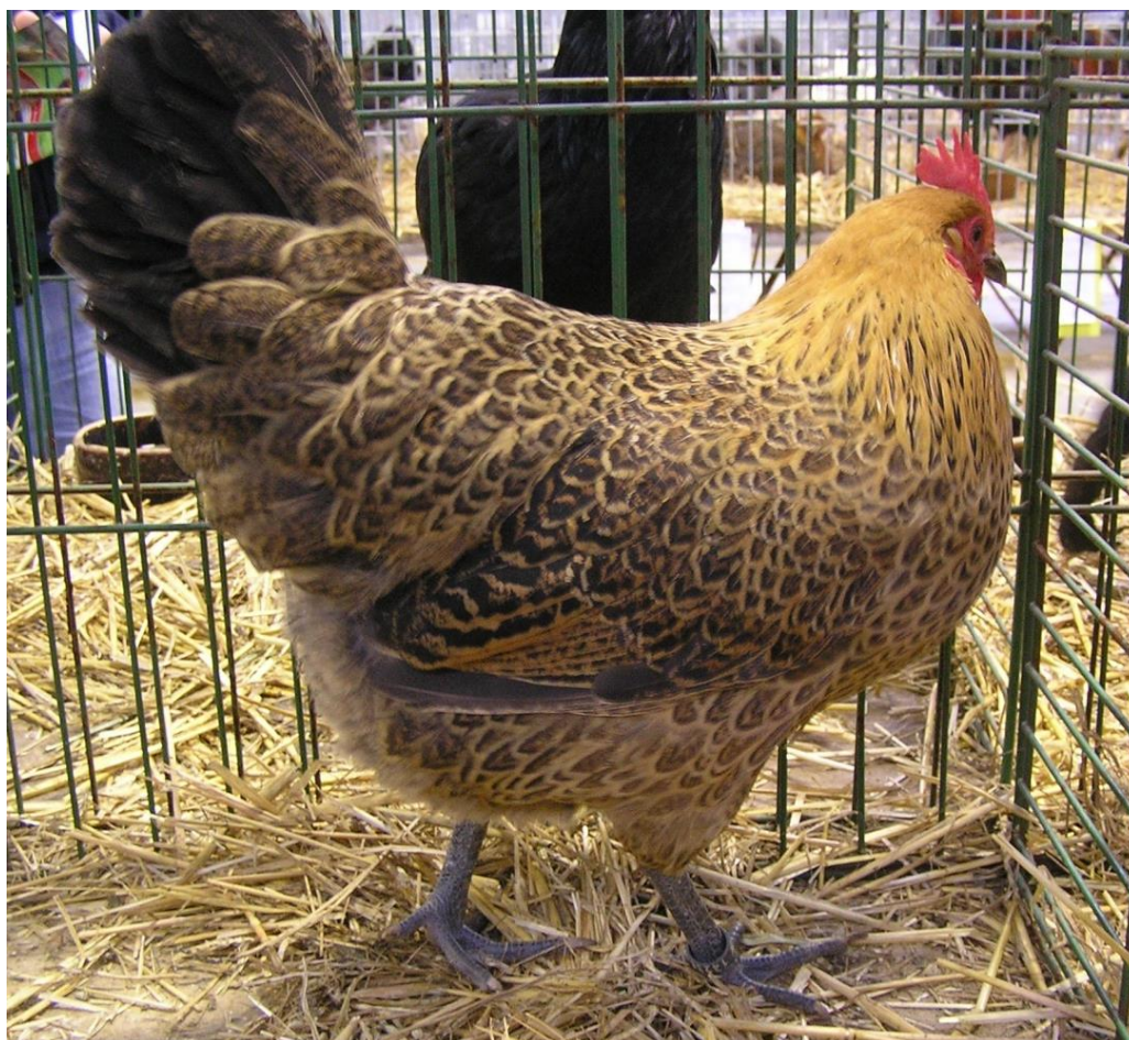
Česká slepice zlatě kropenatá oceněná 99 body v roce 2014 na CV v Lysé n.L

Česká slepice zlatě kropenatá je lehké plemeno nosného užitkového typu. Je dobře přizpůsobená tvrdším podmínkám prostředí střední Evropy. Vyznačuje se velmi živým temperamentem (přelétne i 3 metry vysoký plot), je plachá, ostražitá a nenáročná na krmění. Hmotnost kohouta je 2,3-2,8 kg, slepice 2-2,5 kg. Průměrná roční snáška vajec se pohybuje kolem 150-190 vajec. Barva vaječné skořápky je krémová. Slepice mají vyvinutý mateřský pud, jsou dobrými kvočnami.