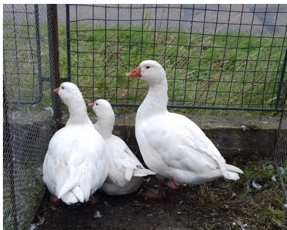
husy české Miroslava Zemana oceněné ČC