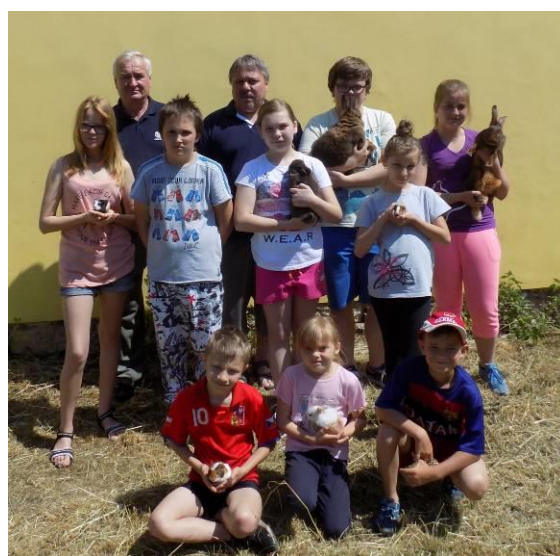
Závěrečné foto všech zúčastněných