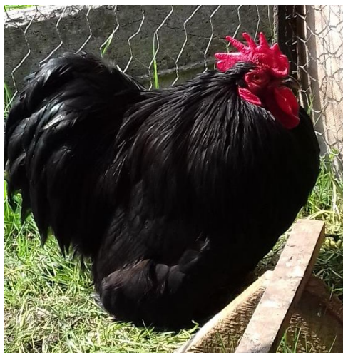
vítězný kohout kočinky zakrslé černé př. ing.Petra Blažka