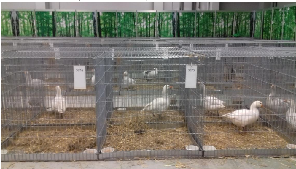
pohled na soutěžní expozici hus