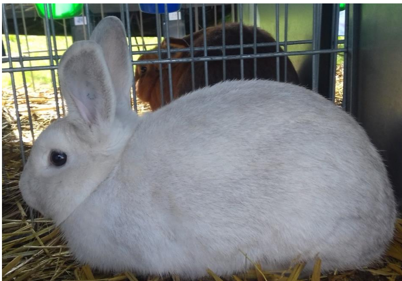
1.0 Ččp př. Stanislava Valenty oceněný 95 b. – člen vítězné kolekce malých plemen