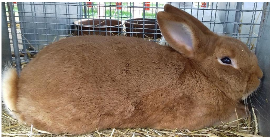
Novozélandský červený MCH Diany Tucauerové oceněný 95,0 b.