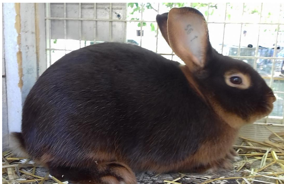
Thav př. Vratislava Vojtěcha oceněný 95,5 b. – člen vítězné kolekce