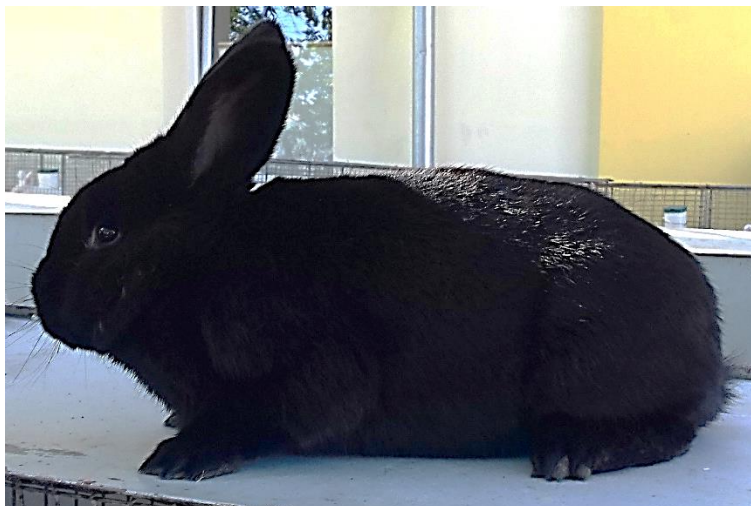
Aljaška př. Bohumila Vanička, která mu dopomohla k zisku titulu vicemistra okresu