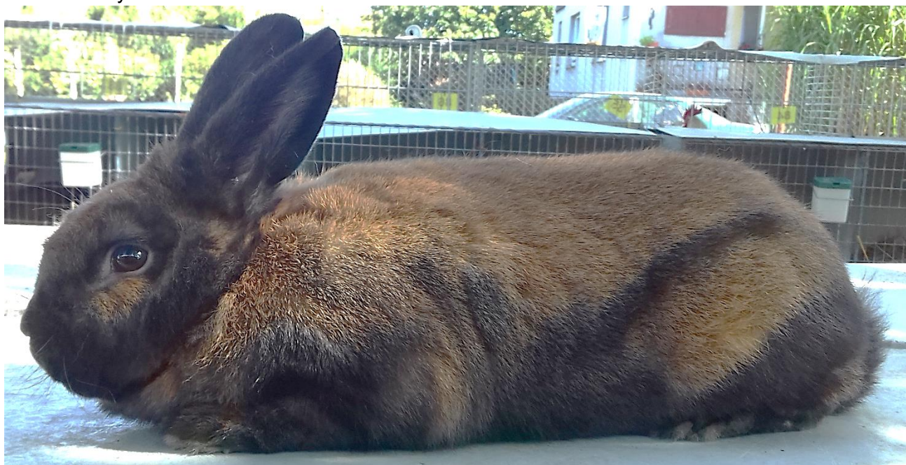
Durynský př. Břicháče oceněný 95,5 b. z kolekce 378,5 b. (čc)

Králíci potvrdili svoji kvalitu a je jen škoda, že se nemohli poměřit s celorepublikovou konkurencí na odvolané CV v Lysé n.L.