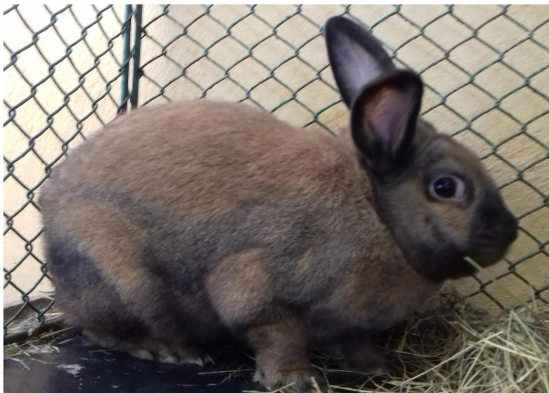
V ukázkové expozici byl k vidění například i durynský