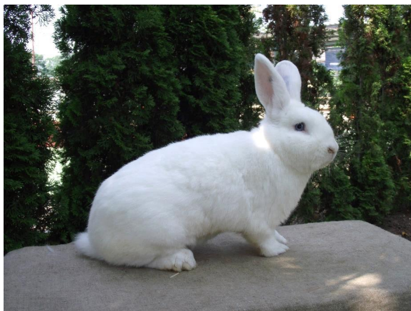
vídeňský bílý př. Jiřího Cika oceněný 95,5 – vítěz 1.0