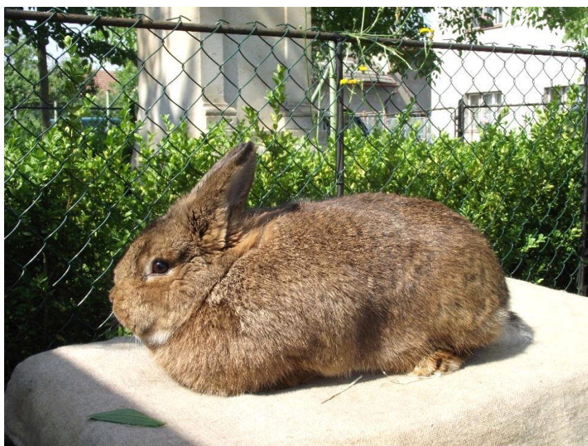
vídeňský šedý oceněný 95,5 b. – vítězná 0.1 chovatel př. Karel Kouřilek