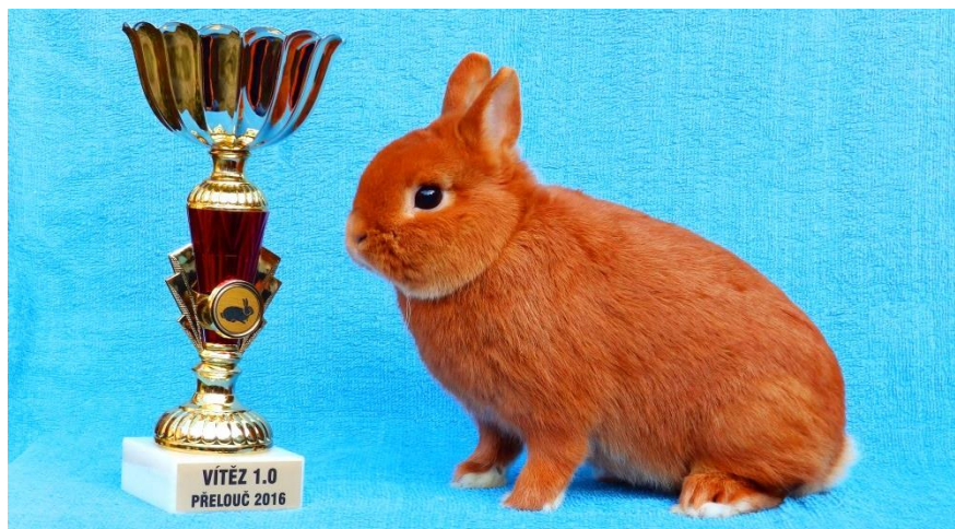
vítězný 1.0 - zakrslý červený chovatelky Lucie Stehnové oceněný 96 b.