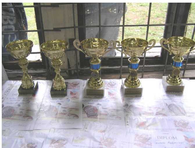
poháry a diplomy pro vítěze