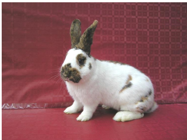
ČSČŽ – vítěz. 1.0 - chov. Hrstka Ladislav