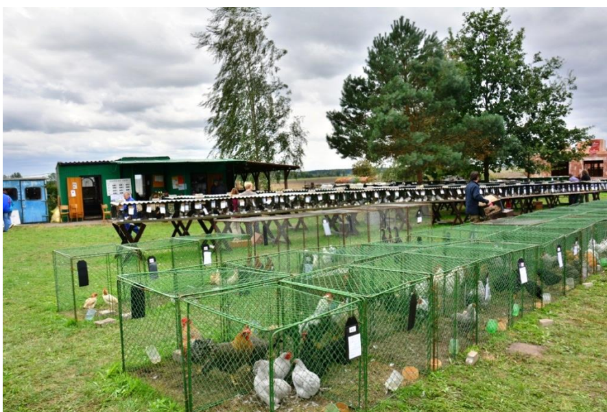
pohled na výstaviště