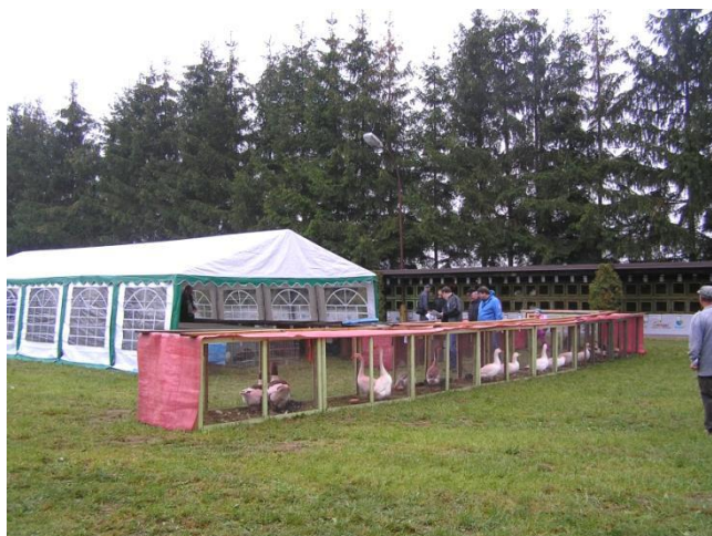
pohled na výstavní areál