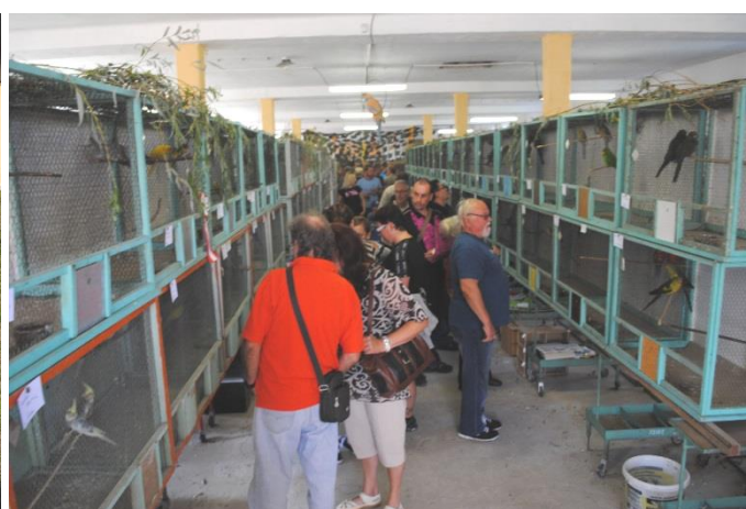
okresní výstava exotického ptactva se těšila přízni veřejnosti