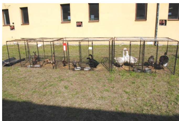
pohled na venkovní expozici drůbeže

Výstava ve Vlčí Habřině byla letos opět pojata jako soutěžní pouze u exotického ptactva, ostatní zvířata byla předvedena v ukázkových expozicích. Výstava má svoji tradici a publikum, které láká především doprovodný program (dechové hudby, prodejní stánky, jízdy v kočářích, ukázky modelářů, ručních prací, květin a dalších atrakcí). Letos výstavu navštívilo 850 platících návštěvníků, pro které připravilo 136 účinkujících, pořadatelů a vystavovatelů zajímavou podívanou. V rámci výstavy proběhlo setkání chovatelů Klubu brněnských voláčů z ČR a hostů ze Slovenska, Rakouska a Polska.