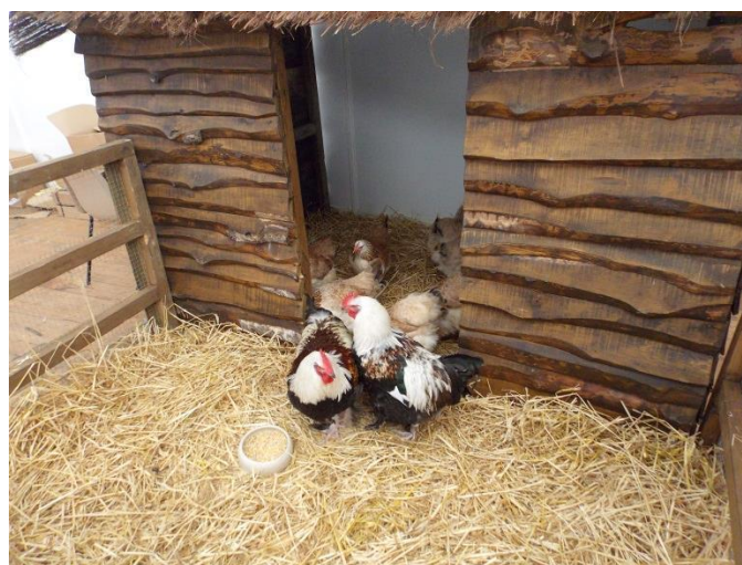
pohled na část výstavní haly a na jednu z ukázkových expozic