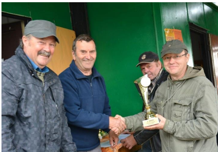
slavnostní vyhlášení výsledků