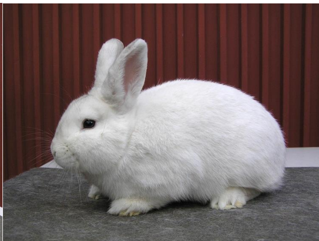
1.0 velký světlý stříbrný – 95 b. – chovatel Kulhánek Lukáš a 0.1 český černopesíkatý – 95 b. – chov. Kašpar Ladislav