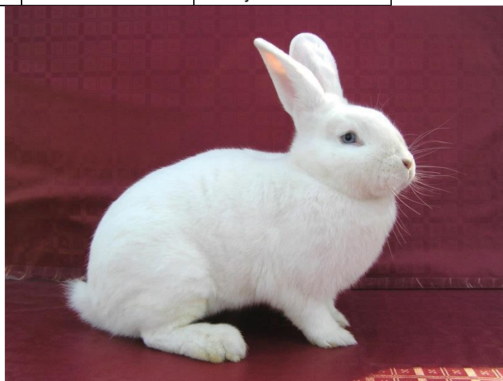
0.1 vídeňský bílý – (95,5 b.) – chovatel Cik Jiří